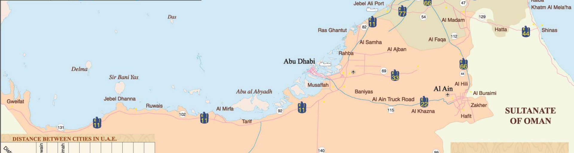
DISTANCE BETWEEN CITIES IN U.A.E.