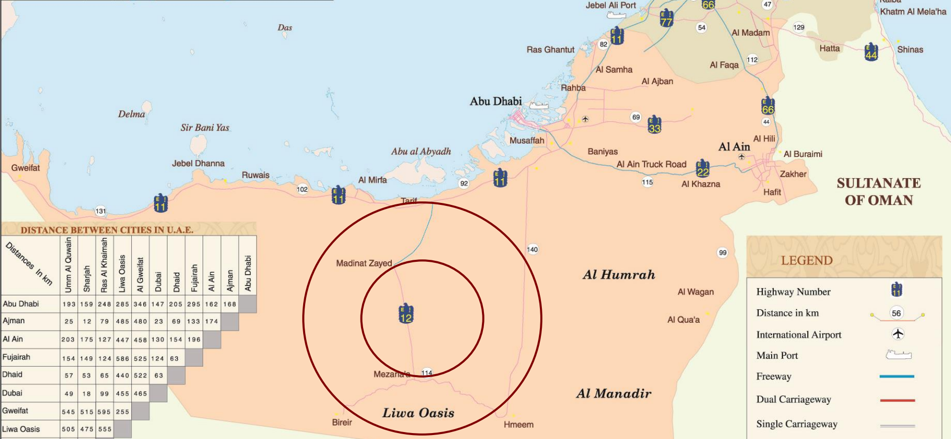
DISTANCE BETWEEN CITIES IN U.A.E.