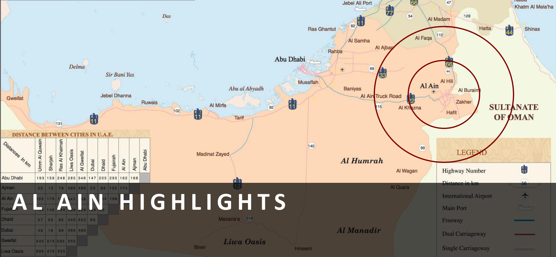
DISTANCE BETWEEN CITIES IN U.A.E.